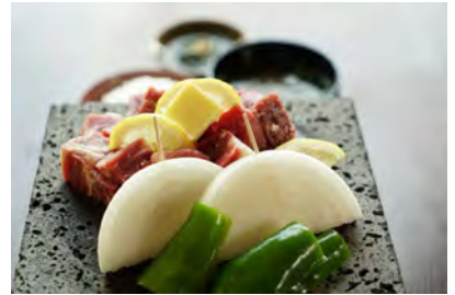
ステーキ溶岩焼き