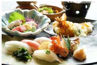
おまかせ定食 お寿司付き