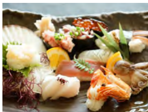
お昼だけの寿司定食