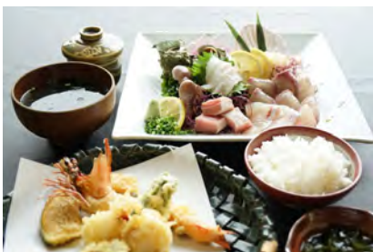
お刺身定食 天ぷら盛り付き