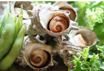
さざえのつぼ焼き