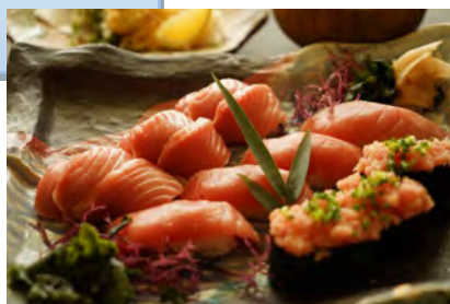
生まぐる寿司定食 3500円