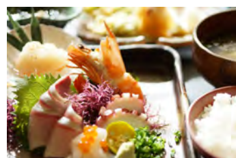
お昼だけの刺身定食