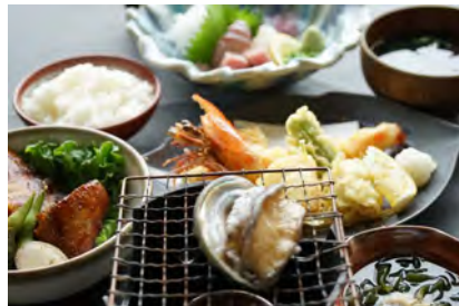
おまかせ定食 あわび付き