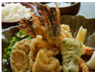
お昼だけの天ぷら定食