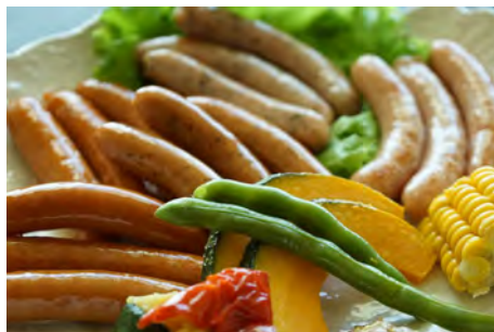
ソーセージ盛合せ