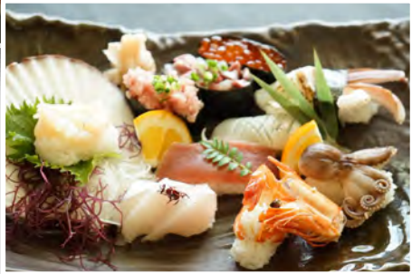
お寿司 海鮮盛合せ 1800円